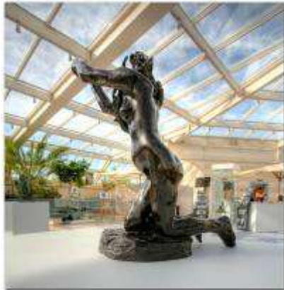
Exposition Camille Claudel

Outre les spectacles proposés, le C.I.D a créé de nouveaux événements pour les touristes présents à Deauville. Nul n'oubliera la magnifique exposition de plus de 60 œuvres de Camille Claudel en juillet-août qui a accueilli plus de 15000 visiteurs et a généré de nombreux articles dans les médias, valorisant la politique culturelle de la Ville. On notera également l'organisation de Loisirsland, 1 er parc d'animations en intérieur, dans les halls du C.I.D où, sur plus de 5000m 2 , 7000 enfants et parents ont découvert ensemble un espace entièrement dédié au loisir.