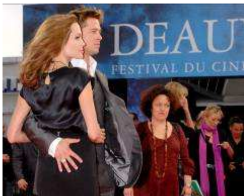
Festival du Cinéma Américain de Deauville 2007