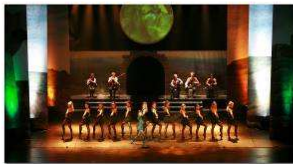
Rhythm of the dance