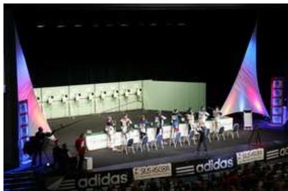
Championnat d'Europe de Tir 2007