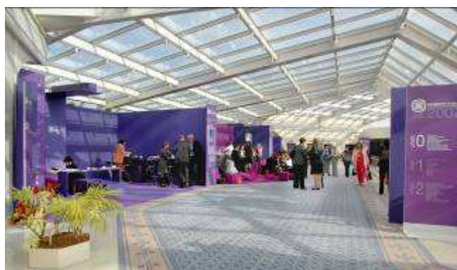
Le Women's Forum 2007

Les secteurs d'activité touchés sont très diversifiés : banques, laboratoires, assurance, Ordre, Industrie et les agences organisatrices d'événements (50% de nos clients directs).