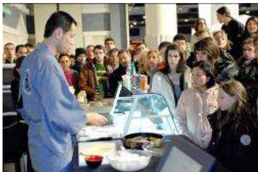
Festival du Film Asiatique de Deauville 2007

Concernant les festivals, le grand public a pu découvrir les villages et animations et assister de façon privilégiée à un plus grand nombre de séances grâce à une nouvelle distribution des cartes d'accès. Le Village Asia avec près de 60 exposants, a séduit un nouveau public. Les nuits américaines ont permis de faire vivre le Festival 24h/24. Enfin, l'exceptionnelle édition 2007 du Festival du Cinéma Américain a considérablement renforcé l'image de la ville.