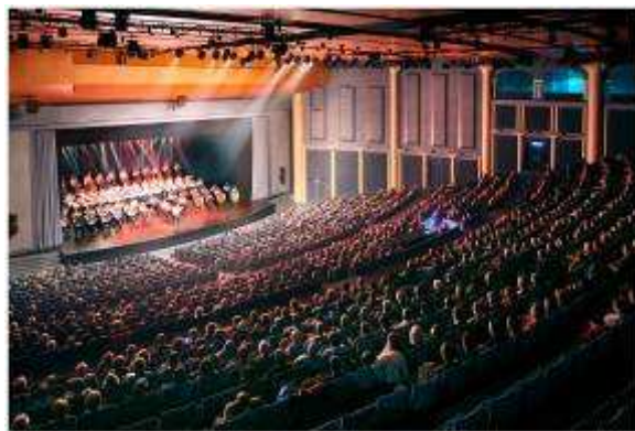
Les 100 violons tziganes

Enfin, cette activité spectacle a amené le Centre International de Deauville à s'équiper d'un logiciel de billetterie qui lui permet aujourd'hui de soutenir l'activité culturelle d'acteurs Deauvillais. En effet, le C.I.D gère entièrement la billetterie du Festival de Pâques et d'Août musical.